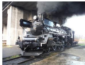
SL C57 180(門鉄デフ装着)